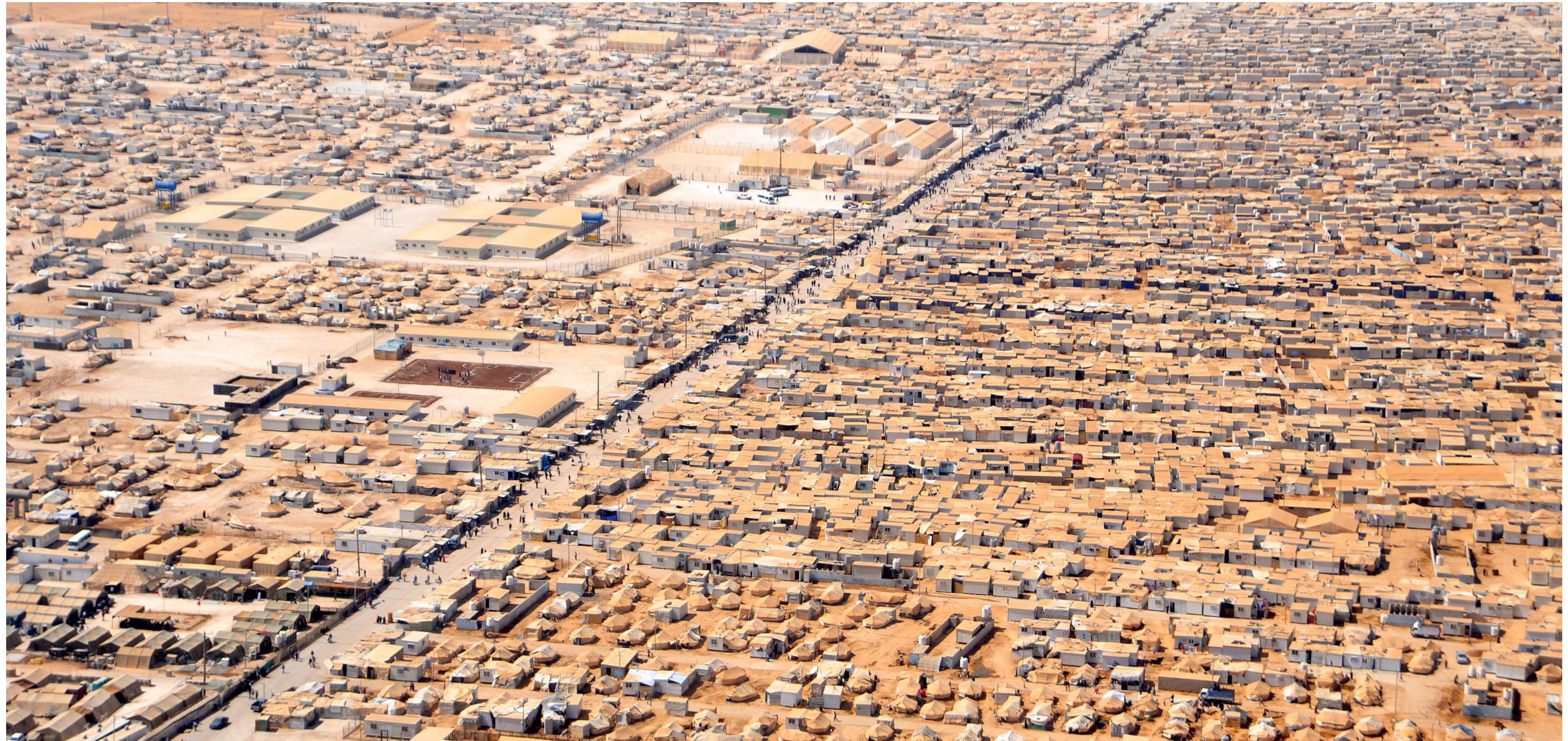
Za'Atari pagulaslaager Jordaanias