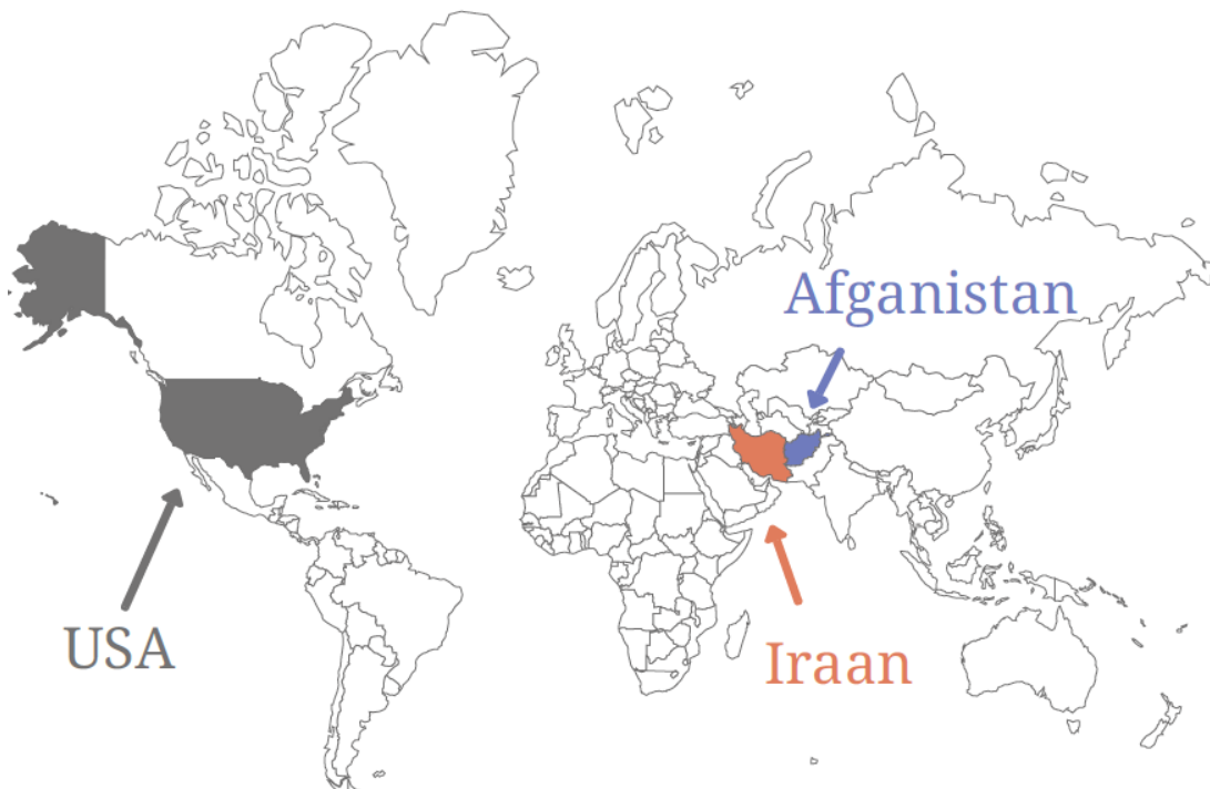
Joonis 2. Sonita elus olulised kohad maailmas.

„Brides for sale” video: https://www.youtube.com/watch?v=n65w1DU8c-GU