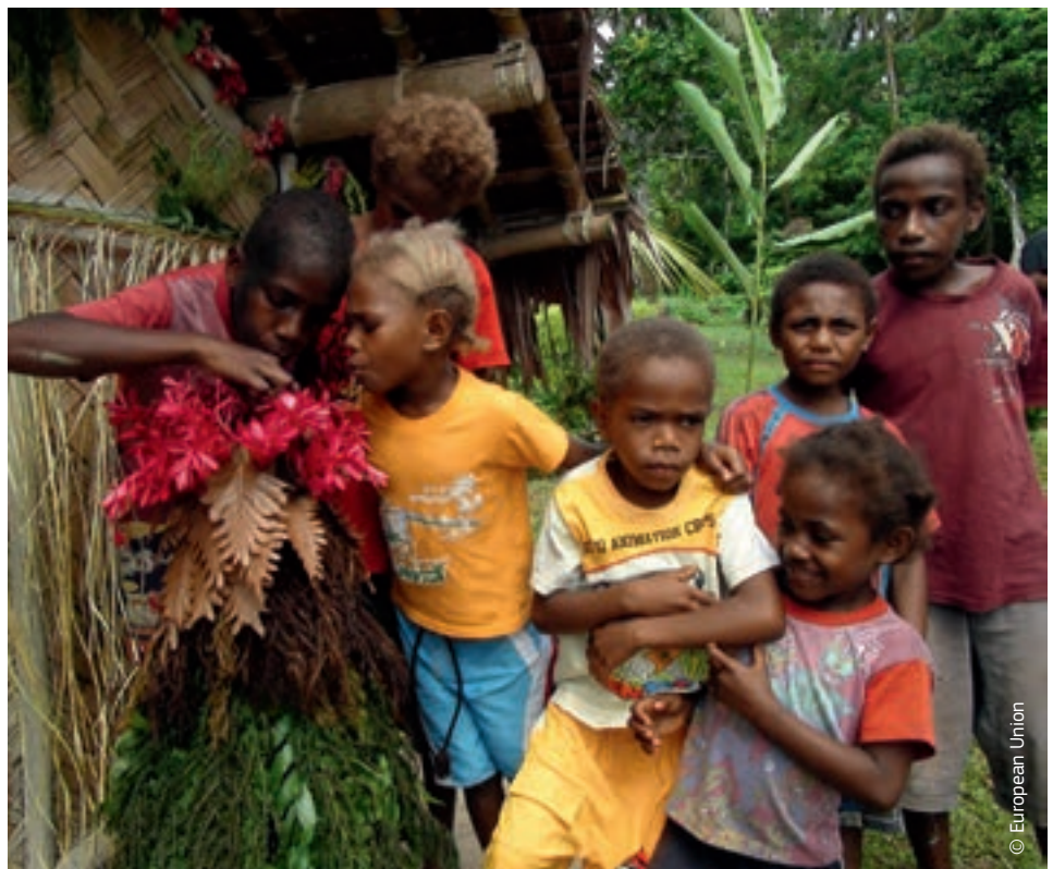
Vanuatu lapsed aitavad ehitada mudelit neid ähvardavast suurimast ohust, Mount Gharati vulkaanist.

Euroopa Komisjoni tähelepanu vastupanuvõime tugevdamisele säästab rohkem inimesi, on kulutõhusam ning aitab vähendada vaesust, suurendades seega abi mõju ning edendades jätkusuutlikku arengut.