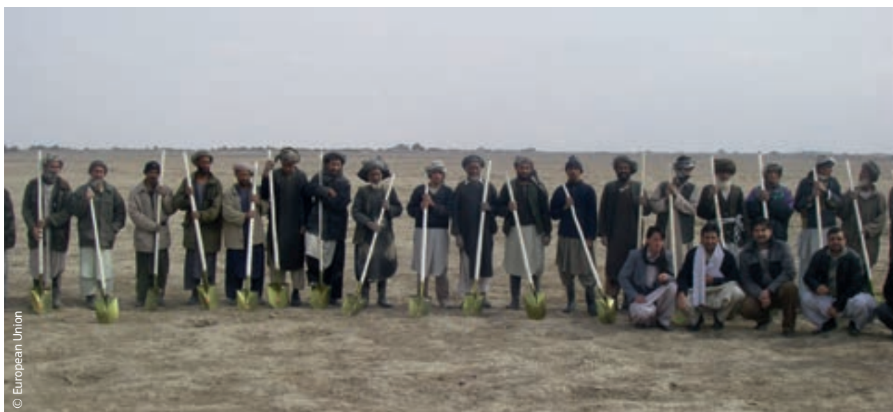
Afganistani elanikud saavad tööriistad osana ECHO rahastatud abist põuast tingitud näljahäda leevendamiseks.

2007. aastal jõudsid ELi institutsioonid ja seejärel 27 liikmesriiki kokkuleppele keskses poliitikadokumendis pealkirjaga „Euroopa konsensus humanitaarabi valdkonnas”. Selles rõhutati, et humanitaarabi ei ole poliitiline vahend, ning kinnitati veel kord humanitaarabi