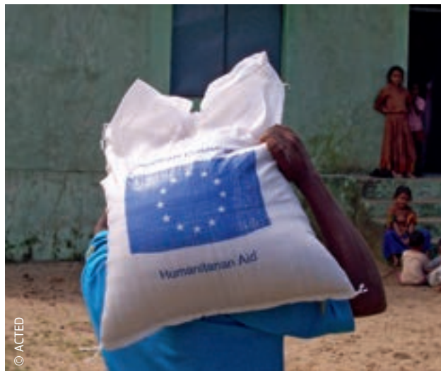
EL on rahastanud humanitaarabi Indias alates 1996. aastast.

ELi kodanikukaitse mehhanismi abil aidatakse selles osalevatel riikidel vältida katastroofe, valmistuda hädaolukordadeks ning ühendada oma vahendid, mida saab siis katastroofist tabatud riikidele koordineeritud ja kiireks reageerimiseks eraldada. Kui ELi humanitaarabi on mõeldud ELi mittekuuluvatele riikidele, siis nimetatud mehhanismi saab kasutada nii ELi-siseste kui ka -väliste hädaolukordade puhul. ELi kodanikukaitse mehhanism tugevdab Euroopa tasandil tehtavat koostööd. See toetab liikmesriikide endi kodanikukaitse süsteeme riiklikul, piirkondlikul ja kohalikul tasandil, võimaldades tõhusaid vahendeid