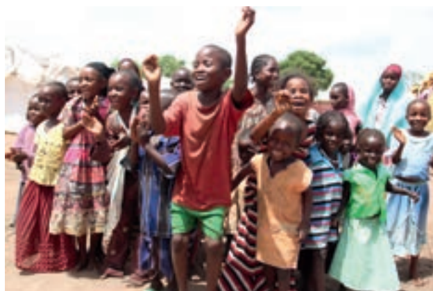
Haridus aitab konfliktis kannatanud lastel lasteks jääda.

Euroopa Liidu rahastatud ja partneritest humanitaarabiorganisatsioonide elluviidud projektide kaudu on algatus „Rahu lapsed” jõudnud rohkem kui 108 000 tüdrukuga ja poisini 12 riigis üle kogu maailma. Seni on algatusega toetatud Pakistani, Kongo Demokraatliku Vabariigi ja Etioopia lapsi, Iraaki põgenenud Süüria lapsi ning Lõuna-Sudaani, Tšaadi, Kesk-Aafrika Vabariigi, Somaalia, Afganistani, Myanmari/Birma, Colombia ja Ecuadori lapsi.