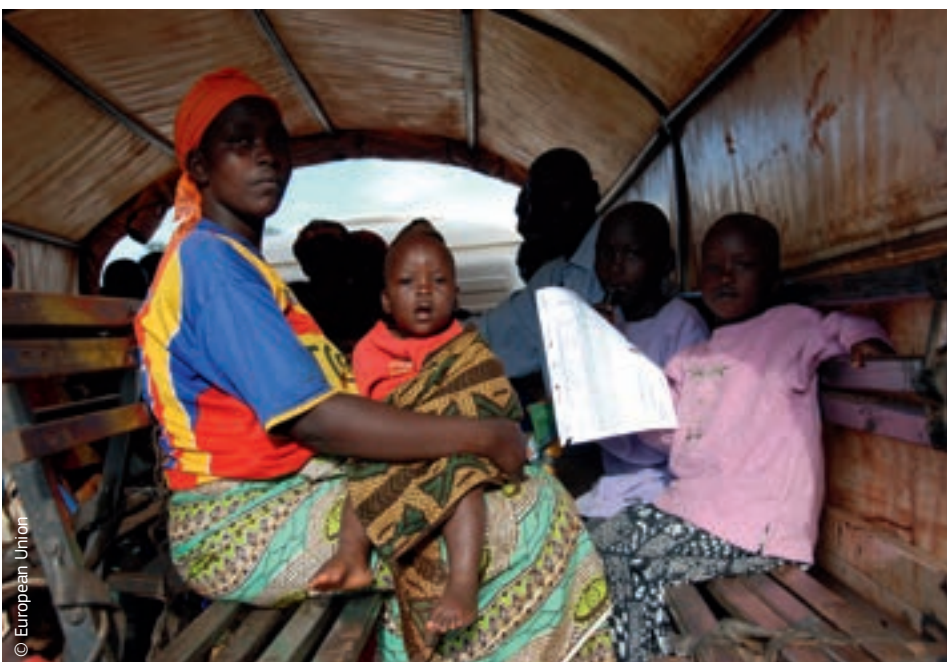
Oma kodukohast põgenema sunnitud Burundi pere sai tänu ELi toetusele koju tagasi pöörduda.

Katastroofide pikemaajalise mõjuga toimetulekuks ning nende ennetamiseks ja nendeks valmisolekuks peab humanitaarabi ning kriisidele reageerimine toimuma käsikäes tegevusega muudes valdkondades, nagu arengukoostöö ja keskkonnakaitse. Seetõttu on ELi tasandil koordineerimine hädavajalik.